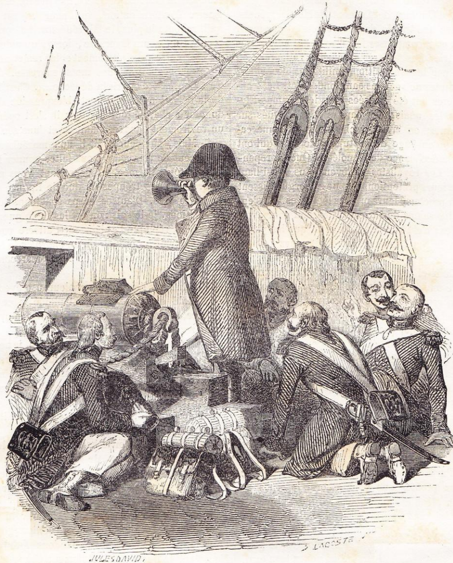
M. roi, commandant ! Napoléon se porte bien, parfaitement bien !

« Ordre du jour. Fontainebleau, le 5 avril 1814.